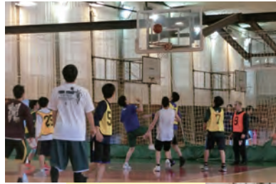
元旦バスケの様子