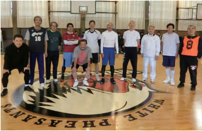
50 歳以上のメンバー